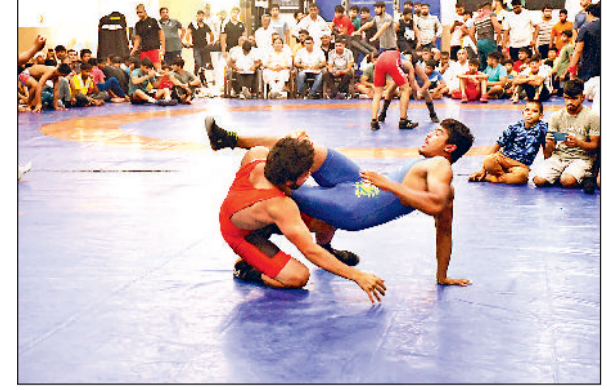
रोहतक। छोट्टराम स्टेडियम में कुश्ती में अपना दमखम दिखाते हुए खिलाड़ी।

उन्होंने फैक्ट्री मालिक पर कार्रवाई की मांग की है। गौरतलब है कि यह पहला मामला नहीं है। इससे पहले भी निगम के सफाई कर्मचारियों और अन्य शाखाओं के कर्मचारियों के साथ दुर्व्यवहार के मामले होते रहते हैं।