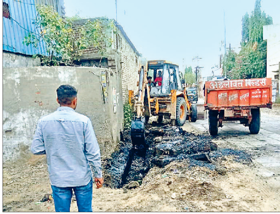
रोहतक। भिवानी चुंगी के पास जेसीबी से सफाई करवाते हुए कर्मचारी, इसी जगह पर हुआ विवाद।

आरोप फैक्ट्री मालिक नाले में डाल रहा खतरनाक केमिकल, आरोपी के खिलाफ पुलिस को शिकायत दी गई, निगम की टीम कर रही है नालों की सफाई